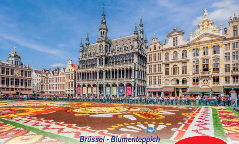
Brüssel - Blument Teppich